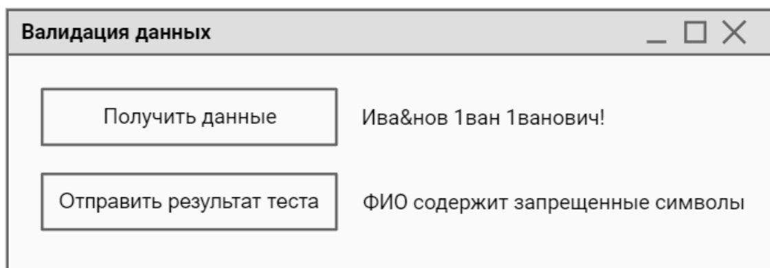
Рисунок - Макет окна приложения валидации данных

При нажатии на кнопку "Получить данные" данные загружаются с эмулятора и отображаются на форме.